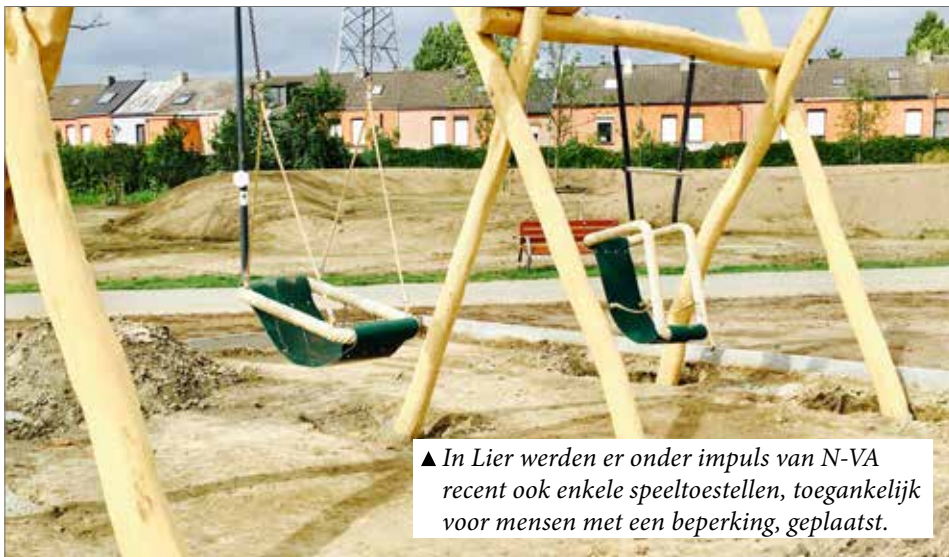
▲ In Lier werden er onder impuls van N-VA recent ook enkele speeltoestellen, toegankelijk voor mensen met een beperking, geplaatst.

N-VA Laakdal bond al meermaals de kat de bel aan op de gemeenteraad. Jammer genoeg stellen wij samen met u vast dat er te weinig werk van gemaakt wordt.