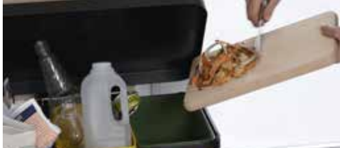
Inzetten op sorteren p. 2