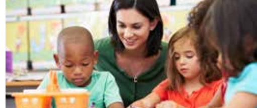
15 plaatsen extra in kinderopvang p. 3