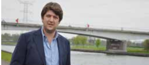
Brug Langvoort blijft! p.2