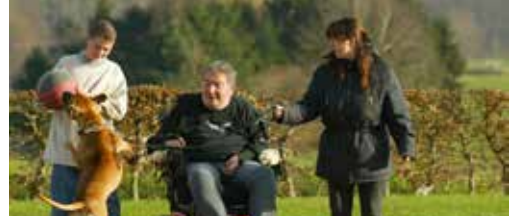
Thema-avond personen met beperking p.3